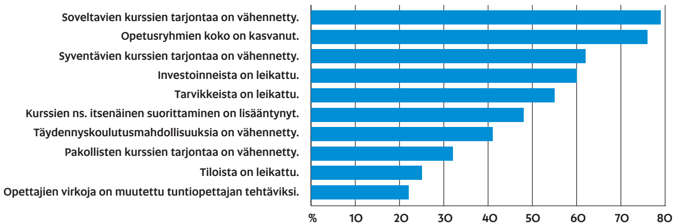
Kuvio 2. Opettajien kokemuksia resurssileikkausten vaikutuksista.

☞ Järjetöntä, että isossa lukiossa on vain yksi erityisope, joka on paikalla vain osan viikkoa. Häntä tarvittaisiin koko viikon ja paljon muuhunkin kuin lausuntojen antamiseen.